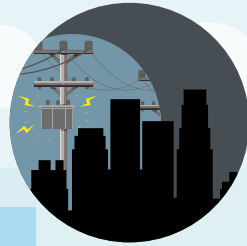
APAGÓN, CORTES DE ENERGÍA