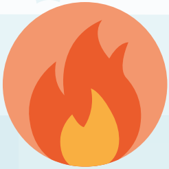
INCENDIO, GAS TÓXICO, OTROS